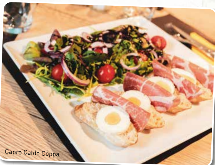
Capro Caldo Coppa