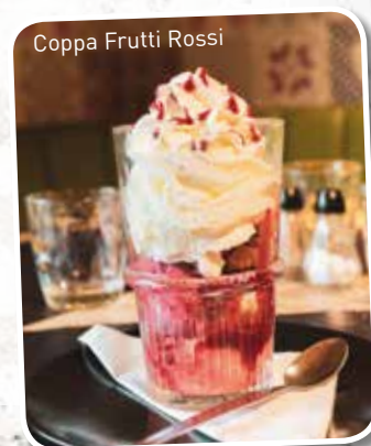
Coppa Frutti Rossi