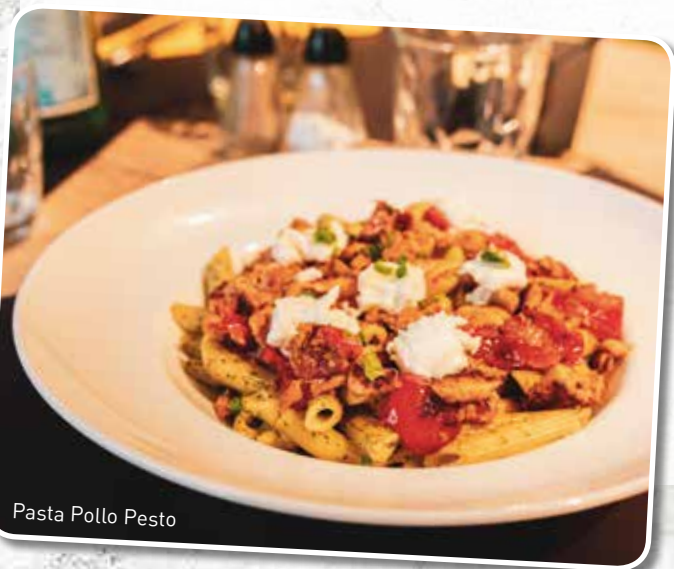
Pasta Pollo Pesto